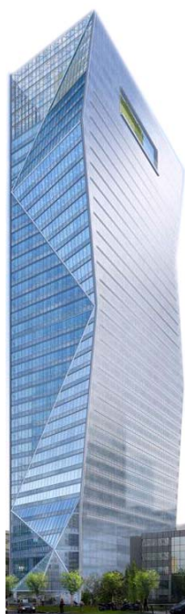
Robert A.M. Stern Architects & SRA Architectes

« Tour Carpe Diem » à La Défense : 1 ère tour en France à s'inscrire dans une démarche de double certification environnementale HQE® et LEED® Gold